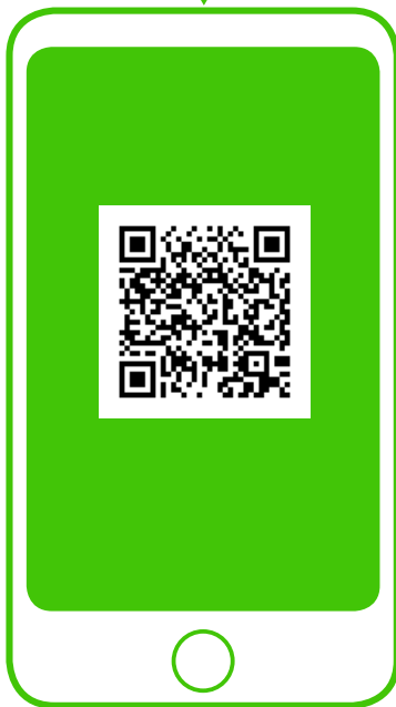
※新型コロナ対策パーソナルサポート（行政） QRコードから登録