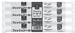
70g×4 ノンクリップで分別不要です。

エコラベルのついたスケソウダラで作ったフィッシュソーセージ「CO-OPフィッシュソーセージ」は、2018年3月に世界で初めてMSC認証の海のエコラベルが付いたアラスカ産スケソウダラのみを使用した魚肉ソーセージです。