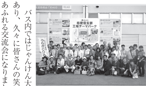
桔梗屋信玄餅工場(2号車) 記念写真

4年ぶりに開催された、バスでの組合員交流会は山梨方面を訪問しました。多数の募集をいただきましたが、抽選となりバス2台81名の参加でした。店舗でも取扱のあるワイナリー、1号車は盛田甲州ワイナリー、2号車はフジクレールワイナリーに分かれて見学と試飲を行いました。様々なワインの味を飲み比べて好みの味を見つけていました。