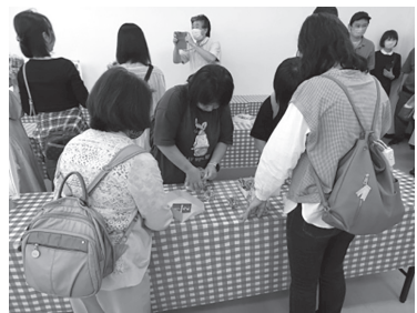
何個詰められるかな～ 縦につめたり横にしたり真剣です。

最後は、武田信玄ゆかりの恵林寺を散策。見事な境内を見学しつつゆったりとした時間を過ごしました。