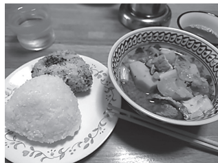
産直米試食・芋煮会やります! (写真はイメージです)

12月2日(土) 予定 詳細は決まり次第お知らせします。 産地の方と交流しましょう