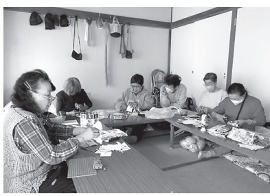
久里浜駅近くの会場で活動しています。