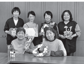
メンバーの皆さん 「一緒に楽しみましょう」

フィンホームは昨年6月に新しく誕生したサークルです。現在8名のメンバーで活動しています。 活動内容はトールペイントの作品作りです。トールペイントは、木やプラスチック、皮などに筆と絵の具で絵を描いていくクラフトです。サークルメンバーは長い間トールペイントをやっていた経験者が多く、各々で自分の作りた作品をじっくり作っています。作品を鑑賞しあったり、アドバイスしあったり、みんなでおしゃべりしながら楽しんで作品を作っています。