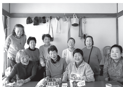
花水木メンバーの皆さん 「楽しいので、ぜひ遊びに来てください」