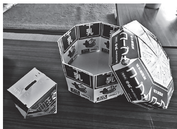
牛乳パックを使った作品 小物入れと貯金箱

そのほかにも、棒針・かぎ針での編み物でマフラーやかばん作成に取り組み、限られた時間で各々の作品作りを楽しんでいました。終始楽しい会話が弾み、皆さんでわいわい楽しい時間を過ごされました。