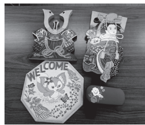
作品例 こんな素敵なものがつくれたらいいですね。

うらがCO-OPでは、先生に教わる習い事ではなく同じ趣味を持った人が集まって楽しむ『サークル』があります。コロナ禍が明けて何か始めたい、楽しく集みたいあなた！サークルに参加しませんか？ (加入可否、参加費用はサークルによって異なります。各サークルの紹介をご覧ください)