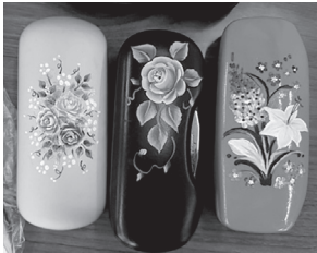
体験で作れる眼鏡ケースの作品例。うまくいかなくても大丈夫。体験してみてください。

はじめは難しいかなと心配でしたが、やっているうちにとても楽しくなりました。加入後、材料や道具、昼食は各自で購入・持参していただきます。 経験者でも初心者でも絵を描くことが好きなら一緒に楽しみませんか？