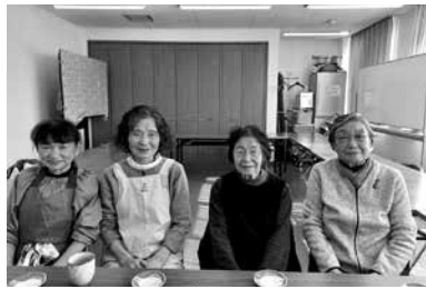
美味しんぼ メンバーの皆さん 「いろいろ勉強になりますよ。 食に関心のある方はどうぞ」

この日の献立は、ジャガイモとわかめの炒め物・小松菜の煮びたし・リンゴと干しブドウをつまみもの煮物・浦賀店の焼き魚・ごはん(つや姫)です。 ほかにも新年会をやったり、外食で器や盛り付け方の勉強をしたりします。 食材費のみ実費負担です。実用的な料理を知りたい方参加してみませんか?