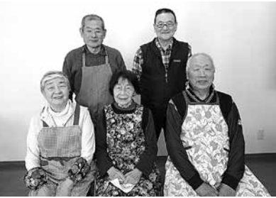
メンバーの皆さん 『料理を楽しみましょう。』

うらがCO-OPでは、先生に教わる習い事ではなく同じ趣味を持った人が集まって楽しむ『サークル』があります。今回は長い間続いている食に関するサークルをご紹介します。あなたも参加してみませんか? (加入可否、参加費用はサークルによって異なります。各サークルの紹介をご覧ください)