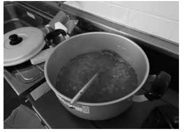
ミネストローネ制作中 短時間でできるように工夫して作っています。

完成後はみんなで実食。反省や評価の会話が飛び交います。時々居酒屋やレストランに出向いて、プロの食の勉強をしたり、メンバー同士のコミュニケーションを図ったりしています。