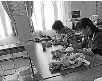
みんなで食べる食事は 美味しいですよ

「美味しんぼ」は1999年に設立した、料理サークルです。大津(第一地区)のメンバーで設立したサークルで、以前は大津店の2階で活動していましたが、閉店に伴い浦賀店2階で活動することになりました。 活動の内容は、生協の安全な食材を使って、家でお惣菜になる料理を作ることです。簡単で手早く作れる料理を教えあい(食のロマンの指導者もメンバーになっています)毎日の食事作りに役立つ情報や、おいしかった生協の食材について話したりしています。 そういったおしゃべりも楽しみに活動しています。