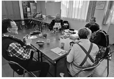
食べながら反省会。 美味しいミネストローネ、家でも作ってみよう。

以前開催されていた「協同まつり」では焼きそばを作り日頃の鍛錬の成果を披露。大変好評でした。健康と認知症予防のためにも、これからも楽しく活動していきます。