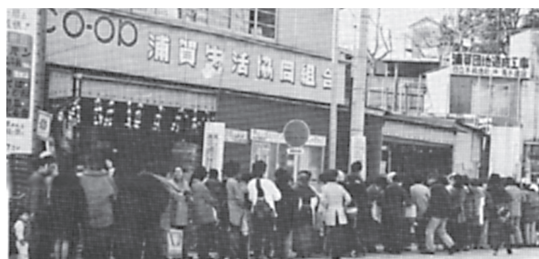
1973年11月オイルショック トイレットペーパー・洗剤・砂糖を求めて店舗前は大行列