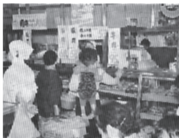
1962年に本部売店に作られた精肉売り場

70年 時代の流れの中で組合員の生活を支え、組合員とともに大きく成長しました。昭和30年浦賀船渠株式会社職域生協として設立。第一売店(旧本部店)が開店。うらがCO-OPの歴史はここから始まりました。