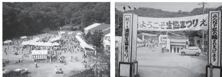
1977年第1回生協まつり みかん山グランドにて

7年後、旧本部店が大幅増改築。のちに販売方法も対面からセルフサービス方式となり、来店者は商品を手にとって自由に選べるように店内の様子も変わりました。開店当初はお店に冷暖房もなく夏は来店者にうちわを用意。冬は店の隅に火鉢を置いたり、嘘のようなホントのことでした。