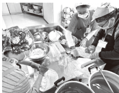
一生懸命大豆をつぶします。

たっぶり水に浸し、当日は3時間かけてコトコト。アクを取りながら、柔らかくなるまで丁寧な煮上げました。 いよいよ本番。材料をテールに分け、皆で一生懸命つぶしていきます。今年は初めての方も多かったのですが、皆さん事前に予習をされていたようで、その手際の良さにアシスト役の自分があたふたしてしまふ一幕も。嬉しい誤算に、少々面目なかつたかな……と苦笑いしてしまいました。 「美味しくなれ」と思いを込め、麴を混ぜてフリーザーバッグへ。袋の隅までしっかりと詰め、空気を抜いて密封すれば完成です！参加者の方から「ワサビの小袋と一緒に入れておくとカビにくくなる」