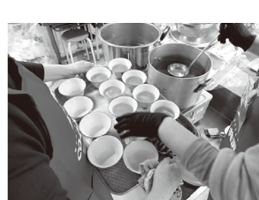
昨年の味噌を使った味噌汁

という貴重な知恵も教わりました。 「簡単でできた」「食べるのが楽しみ」と温かいお声をいただき、感謝の気持ちでいっぱいになりました。うらがCO-OPはこれからも、地域の皆さんと一緒に楽しめるイベントを企画していきますので、よろしくお願いたします。 組合員活動委員会一同