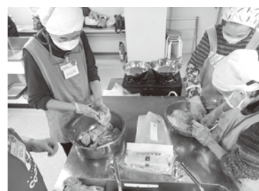
おいしいみそになあれ