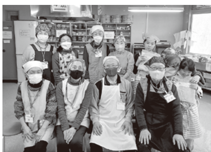
参加者で記念撮影

という貴重な知恵も教わりました。 「簡単でできた」「食べるのが楽しみ」と温かいお声をいただき、感謝の気持ちでいっぱいになりました。うらがCO-OPはこれからも、地域の皆さんと一緒に楽しめるイベントを企画していきますので、よろしくお願いたします。 組合員活動委員会一同