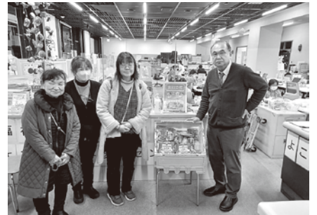
寄贈先のフードバンクかながわ(左)と横須賀市民生局福祉部生活支援課(右)

「フードバンク」とは 家庭や食品企業から、賞味期限内にかかわらず廃棄されてしまう食品を引き取り、食品を必要としている福祉施設等へ無償で提供する団体・活動をいいます。